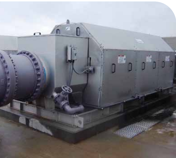
El filtro automático Rotoshear PF posee la integridad de un filtro Rotoshear®