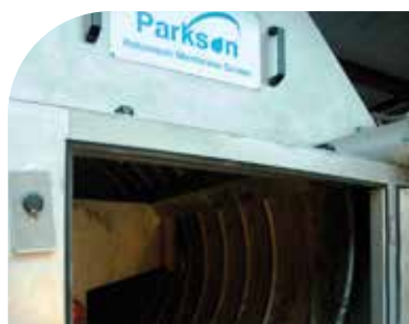
Fuerte y resistente; prolongada vida útil, bajo mantenimiento